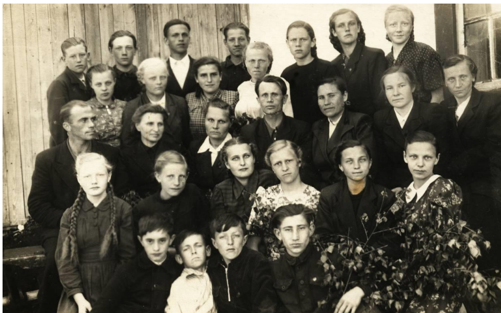
Коллектив учителей и учеников Солнцевской семилетней школы, 1953 год