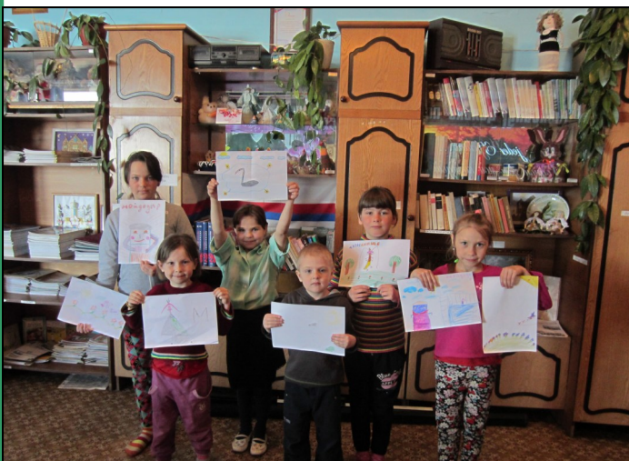
Мы любим сказки Корнея Чуковского

К юбилею детского писателя К. И. Чуковского (135 лет со дня рождения) была приурочена викторина «Мойдодыр, Айболит и другие», состоялась презентация книг Корнея Ивановича, а также книг сказок немецкого писателя-юбиляра Вильгельма Гауфа (в ноябре – 215 лет). Дошкольники и учащиеся начальных классов рисовали рисунки к любимым произведениям.