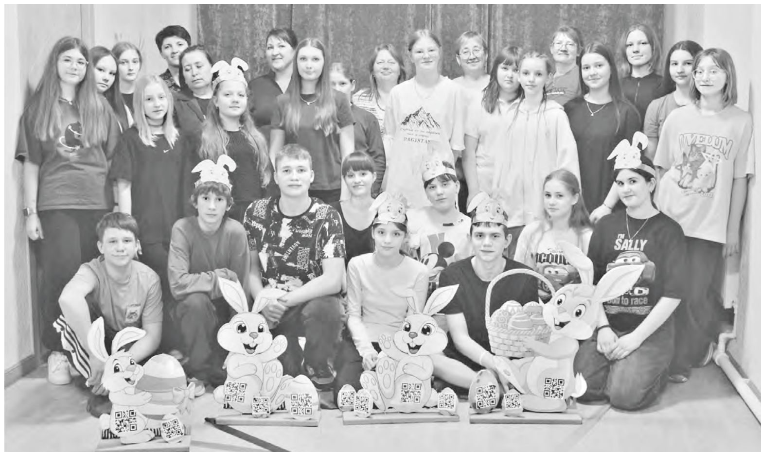
In der „Osterwerkstatt“ tauchten die Kinder und die Lehrkräfte in die fröhliche Atmosphäre des Osterfestes ein.

Das Projekt wurde vom Internationalen Verband der deutschen Kultur im Rahmen des Förderprogramms zugunsten der Russlanddeutschen in der Russischen Föderation umgesetzt.