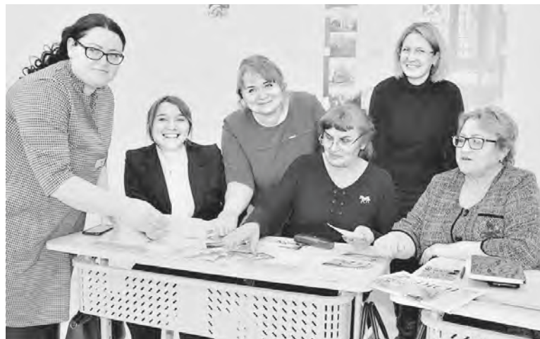
Teilnehmerinnen der Meisterklasse in Sawjalowo während der Arbeit.

In Halbstadt, Deutscher nationaler Rayon, fand die Veranstaltung am 16. März statt. Hier wurde für die Lehrkräfte das Spiel „Karussell“ durchgeführt, in dem die Beteiligten einige Gedichte der russlanddeutschen Autoren kennen