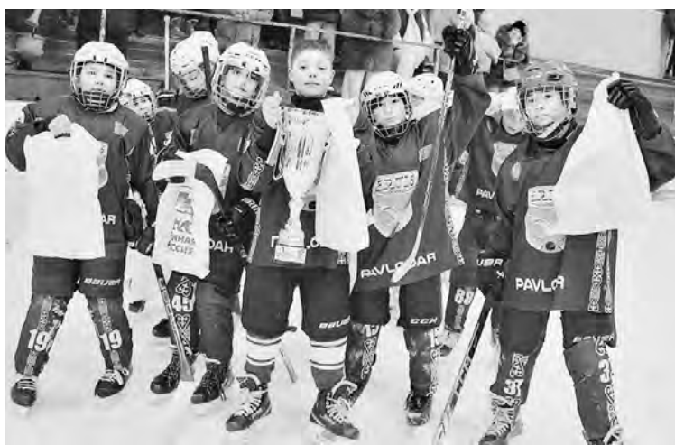
Die Hockeymannschaft „Irtysch“ gewann das Gold des Turniers.