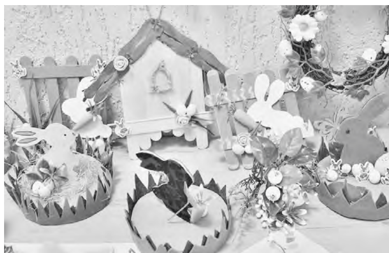
Handwerksarbeiten der Teilnehmer schmückten das Projekt.

Die Führungskräfte, die mit den Kindern zur „Osterwerkstatt“ ankamen, hatten auch keine Zeit für Langweile und arbeiteten fruchtbar. Für sie funktionierte der Workshop „Ostern im Netzwerk: Eine interaktive Seite für die Leiter“. Mit Enthusiasmus eigneten sie sich die Plattform „Genially“ an. Das ist eine Plattform zur Erstellung aller Arten von didaktischen Ressourcen, Präsentationen, Spielen, interaktiver Bilder, Karten, illustrierter Prozesse und anderes mehr, die den Führungskräften in Zukunft helfen kann, interaktive Materialien und Projekte für ihre Zentren anzufertigen. So beschäftigten sich die Lehrkräfte der deutschen Zentren zwei Tage lang mit der Erstellung einer interaktiven Informationssei-