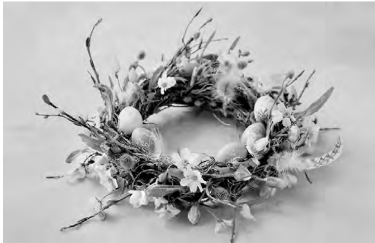
Eins der Hauptsymbole des Festes ist der Osterkranz.

Die Osterkerze begegnet uns schon in der Liturgie, der Gottesdienstordnung, im 4. Jahrhundert. In dem Büchlein „Apfel, Nuss und Mandelkern“ wurde eine Hausandacht mit Bibelstellen zusammengestellt, die von dem Licht handeln, das Gott in die Welt sendet. Von dem ersten bis letzten Kapitel der Heiligen Schrift hören wir von dem Licht, von dem Sieg des göttlichen Lichtes über die Finsternis. Von da her gewann die brennende Kerze, das Licht, das sich selber verzehrt, für die Christen eine besondere Bedeutung. Wenn in einem dunklen Raum Licht gemacht wird, dann geschieht immer ein Doppeltes: Im Schein des Lichtes werden das Unaufgeräumte und auch Schmutz sichtbar, die in der Dunkelheit verborgen waren; das Licht aber ermöglicht uns auch, dass wir aufstehen und arbeiten können, ohne uns zu stoßen und